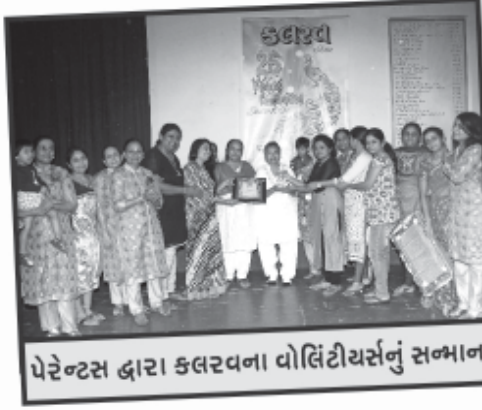
પેરેન્ટસ દ્વારા કલરવના વોલિંટીયર્સનું સન્માન