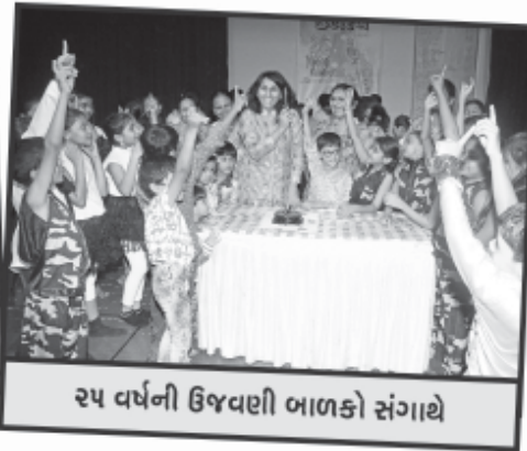
૨૫ વર્ષની ઉજવણી બાળકો સંગાથે